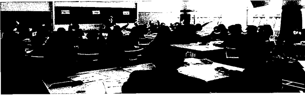
シミュレーションゲーム （体験型学習）の様子