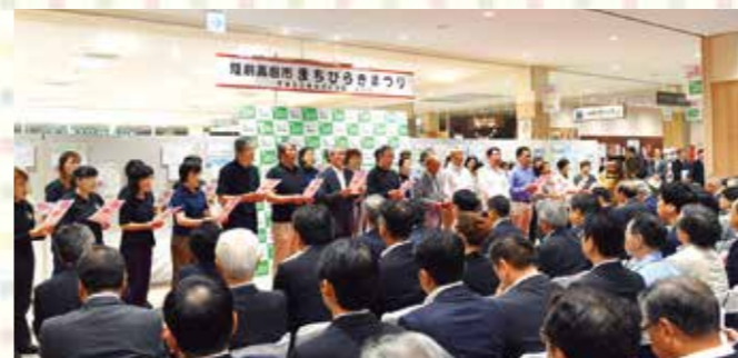
陸前高田市まちびらきまつりの様子