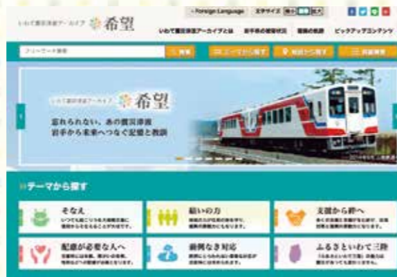
いわて震災津波アーカイブ～希望～ 検索

県では、20万点を超える震災資料を検索・閲覧できる「いわて震災津波アーカイブ～希望～」を公開しています。このアーカイブは、膨大な資料を6つのテーマに分類し、テーマごとに伝えたい経験や教訓を整理。他にも岩手日報社の新聞記事の閲覧や、教育、防災活動などの目的に合わせたコンテンツを活用できます。ぜひご利用ください。