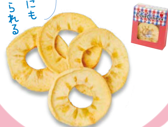
写真は、陸前高田市の「一般社団法人乾燥フルーツCome Come(かむかむ)」の「Come Come習慣」。1箱4袋(10g/袋)入り。厚めの輪切りで、かみ応えがあるので、少量でも満腹感を得ることができます。