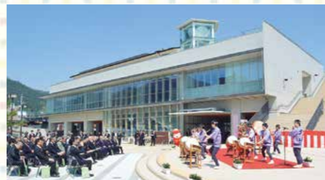
大船渡駅周辺地区第3期まちびらきの様子

大船渡市では昨年4月、大船渡市防災観光交流センターの落成に合わせて「第3期まちびらき」が開催されました。また、陸前高田市でも9月に「まちびらきまつり」を開催。両市ともに、復興が進むまちの姿を発信し、市民と喜びを分かち合いながら、全国からの支援に感謝を伝えました。