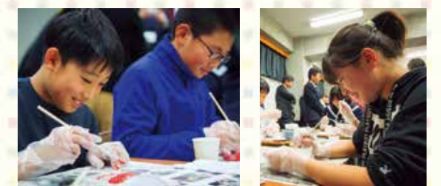
三陸産のホタテの貝殻に色付けして、モザイクアートを作る「かまいし絆会議」の子どもたち。