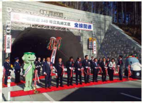
昨年11月に行われた開通式典の様子

遠野市と宮古市をつなぐ一般国道340号「立丸峠」工区が、昨年11月に全線開通。国道340号は、震災で後方支援の拠点となった遠野市から沿岸被災地への自衛隊や消防の派遣、物資輸送で大きな役割を果たしました。一方、道幅が狭く、急カーブと急勾配が続き、冬季には雪崩による通行止めが度々発生するなど交通の難所と言われていました。今回の開通により、危険箇所が解消され、遠野～宮古間の移動距離が約4km、時間が約6分短縮。広域的な防災力の強化や観光の活性化が期待されます。