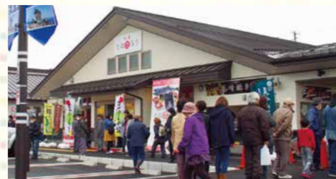
多くの人でにぎわう道の駅「たろう」

2016年から仮営業をしていた宮古市田老地区の道の駅「たろう」が、昨年4月にグランドオープンしました。被災された方が再建した食堂や産直、餅店など、施設も充実。新たな観光拠点と地域の復興の核として、にぎわいの創出が期待されています。