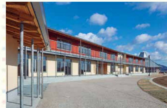
高台に再建された気仙小学校

昨年12月に、陸前高田市立気仙小学校の校舎が完成しました。これにより、震災で被災した沿岸部の公立学校86校の校舎が全て復旧しました。