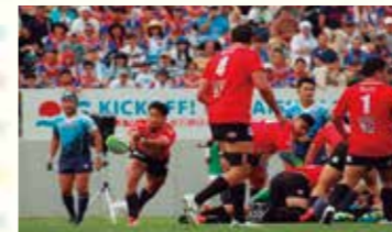
メモリアルマッチ「釜石シーウェイブスRFC VS ヤマハ発動機ジュビロ」の様子

昨年8月、ラグビーワールドカップ2019™日本大会の試合会場となる「釜石鶴住居復興スタジアム」のオープニングイベントが行われました。