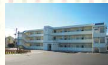
昨年9月、盛岡市内に整備された県営備後第1アパート9号棟

県が沿岸部に整備していた災害公営住宅2,595戸が、3月末で全て完成します。県は、内陸の4市(盛岡・北上・一関・奥州)にも251戸を整備しています。