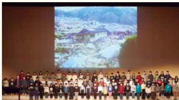
岩手県民会館で行われた発表会で学習の成果を披露する子どもたち。