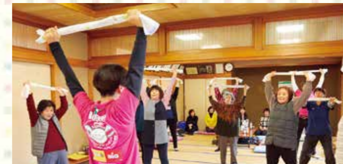
高齢者の交流の場にもなってる運動教室の様子

震災後、暮らしの環境変化に伴い、閉じこもりがちになり、生活不活発病にかかる高齢者が少なくありません。このため、県では新しいコミュニティでの生きがいづくりや健康づくりをサポートする「ふれあい運動教室」を開催しています。教室では、岩手県レクリエーション協会の講師の指導で、ゲームや簡単な体操を楽しみ、お茶を飲みながらふれあいを広げています。