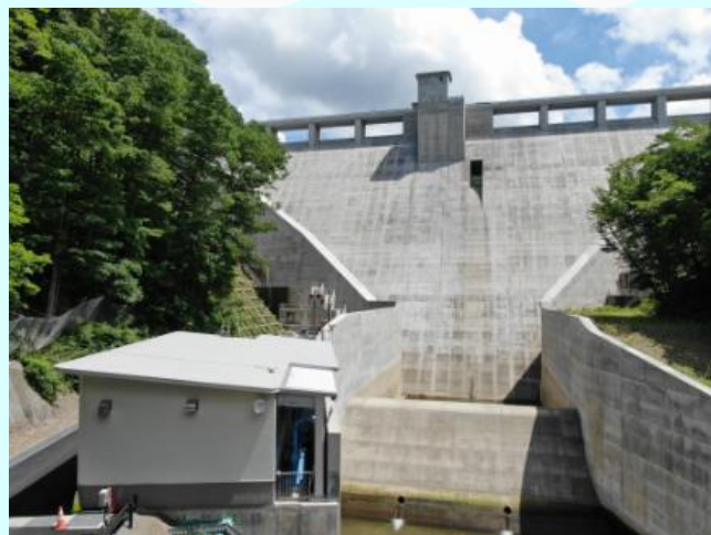
築川ダムと築川発電所