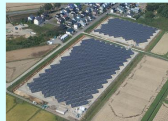
相去太陽光発電所

○岩手県企業局が発電している電気は、一般家庭の 約22万世帯分 （県内世帯の 約4割 ）に相当し、みなさんの家庭や職場で使われています。