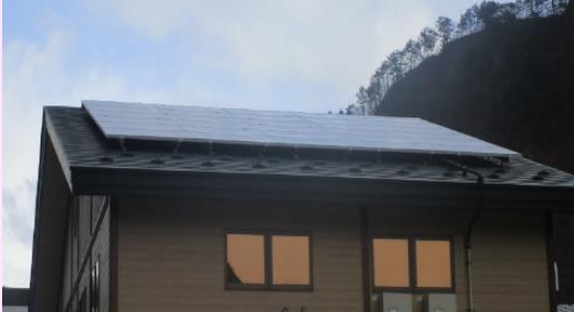
安家地区複合施設 太陽光発電（岩泉町）

この事業を通じて、令和2年度までに県内146地区に、クリーンエネルギーを利用した設備が設置されました。