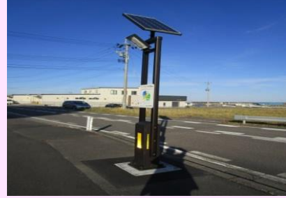
ひろの水産会館 ソーラー照明灯（洋野町）