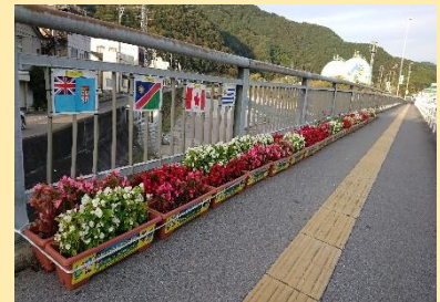
花いっぱい運動（釜石市）

【お問い合わせ先】 岩手県企業局 経営総務室 電話 019-629-6389 岩手県企業局ホームページ https://www.pref.iwate.jp/kigyoukyoku/index.html