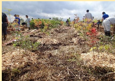
旧松尾鉱山緑の再生活動（八幡平市）

この事業を通じて、毎年約300万円分の苗木や資材を提供しており、令和2年度までに8万本以上の苗木が植えられました。