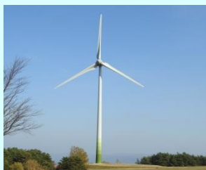
星風の丘 (高森高原風力発電所)