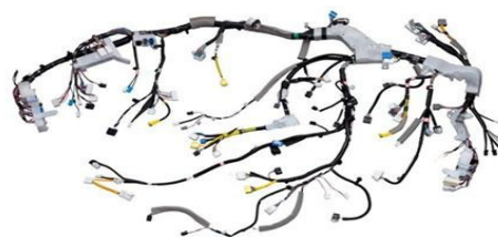
【自動車用ワイヤーハーネス】