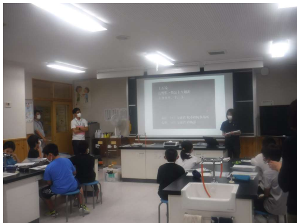
↑土砂災害について学習中！