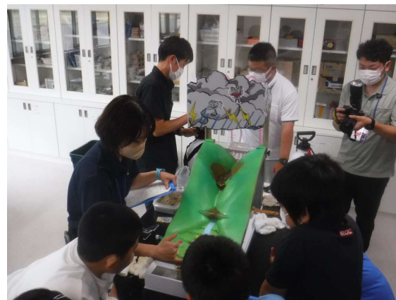
↑模型実験で土石流と砂防堰堤の効果を確認