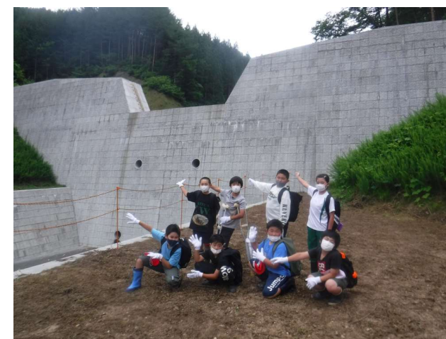
↑砂防堰堤の前でみんなで記念撮影