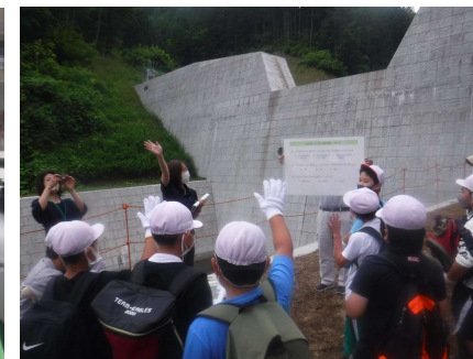
↑砂防堰堤クイズに挑戦！