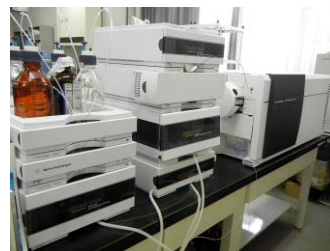
高速液体クロマトグラフ質量分析装置 (LC-MS)