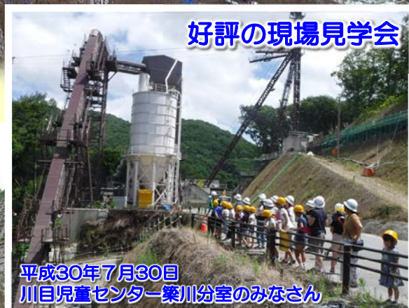
好評の現場見学会