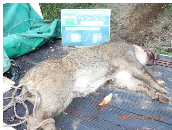
捕獲された野生イノシシ（洋野町）