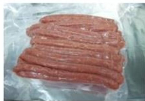
アフリカ豚コレラウイルス遺伝子が検出された真空パックの豚肉ソーセージ