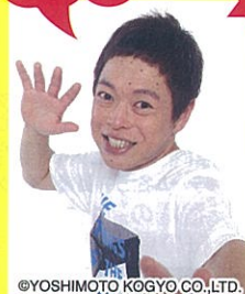
ゲスト審査員は ネゴシックスさん!