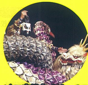
浜田商業高校生による 石見神楽上演!