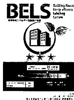
〔図1〕 ガイドラインに基づく第三者認証の例

また、デマンドリスポンスに対応した時間帯別・季節別の電気料金メニューが選択できる場合はその活用にも努めるとともに、エネルギー管理システム（BEMS・HEMS等）の導入により、ビルの運用方法、住宅の住まい方の改善によるピーク対策及び省エネルギーに努めること。