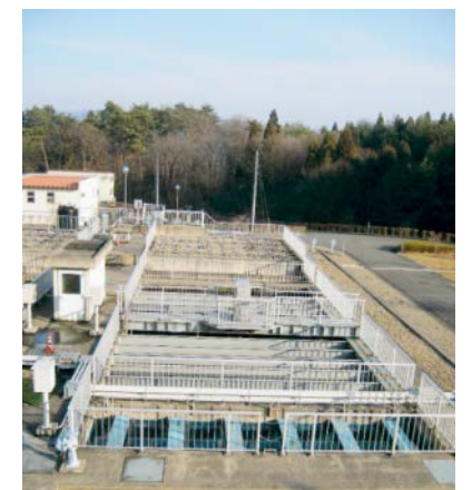
第一北上中部工業水道