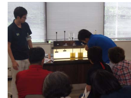
工業用水の実験の様子