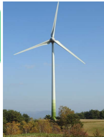
高森高原風力発電所