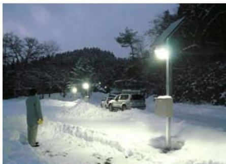
日没後の活動も安全に行うことができます

浄法寺グラウンド(旧浄法寺小学校跡地)に太陽光発電システムの照明灯4基(90W)が設置されました。日中に太陽光で発電した電気をバッテリーに蓄電し、日没後に約6時間点灯します。照明灯には、消費電力が少なく持続性があるLEDライトを使用。経費は約2,309,000円で、うち1,731,000円が県企業局の補助によるものです。スポ少活動や部活動後の片付けを安全に行うことができるほか、防犯にも役立つことが期待されます。