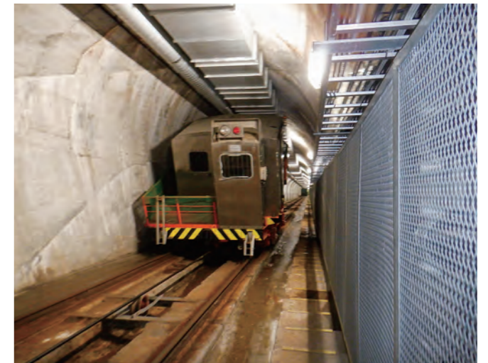
インクライン (地下発電所と地上を結ぶケーブルカー)