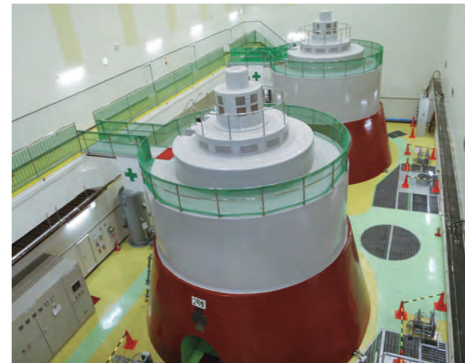
岩洞第一発電所・発電機