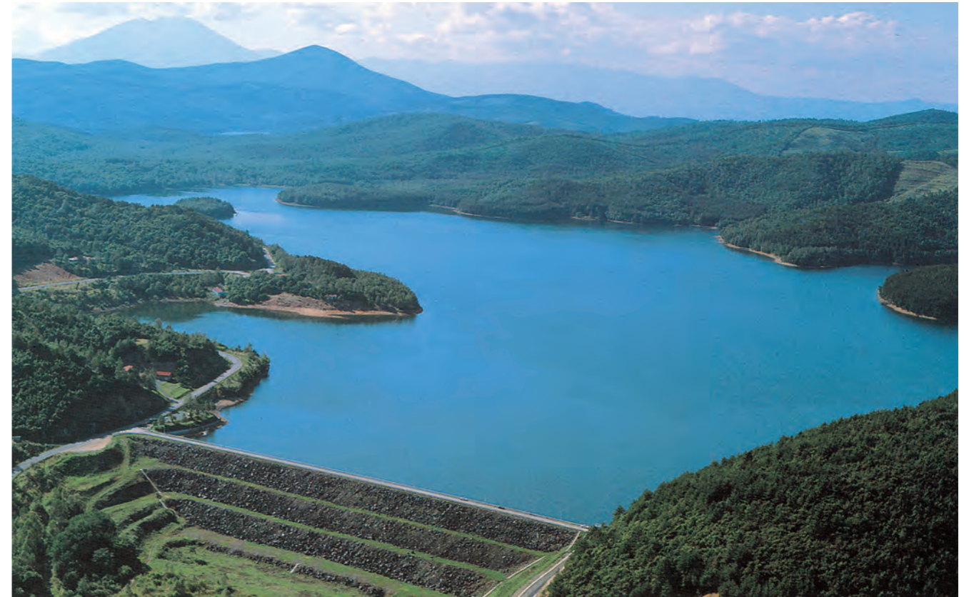
岩洞湖と岩洞ダム