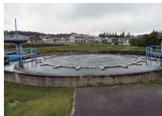
【写真】円筒分水（南北分水工）

上流の岩洞第一発電所で発電した後、写真左上の岩洞第二発電所の水槽を経由し、農業用水管橋（写真中央）を流下して下流の円筒分水へ送水されています。