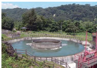
【写真】円筒分水（徳水園）

この施設は、胆沢第二発電所の下流にある、かんがい事業専用の施設です。上流の胆沢第二発電所から放流された水は、ここから下流の田畑へ供給されます。