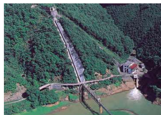
【写真】岩洞第二発電所

写真中央の円筒形のシリンドーゲートは、農業用水として表面の温かい水を取水するため設置されたものです。かんがい期間中は、発電と農業用あわせて最大12.0m 3 /sの水を取水しています。使用中は水中に設置され、水位の変動に応じて自動的に開度を調整しています。