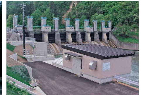
胆沢第四発電所と若柳堰堤