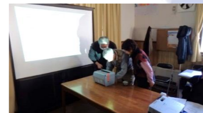
山田共生作業所での出前講演・感染予防の手洗い(H30. 11. 27)

外来待ち合いホールには、患者さん向けに「なるほど・ザ・検査」として検査項目の説明・基準値の冊子、掲示板にインフルエンザ・感染症情報の週報の提供をしています。町民の皆様から愛される病院・検査室になるようにスタッフ一同頑張っておりますのでお気軽に声をかけてください。