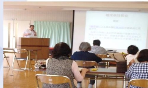
山田町保健センターでの糖尿病重症化・合併症予防教室講演(H30. 6. 28)

この他、院内患者待合ホールでの糖尿病教室や、山田町の糖尿病重症化・合併症予防教室、やまだ共生作業所での出前講座で検査に関する講演を行っています。