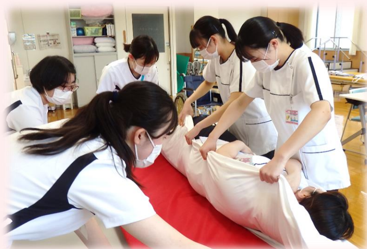
ストレッチャー移送体験

看護衣を着た参加者のみなさんは、血圧測定や車椅子体験、ストレッチャー移送、フットケア体験をおこないました。残念ながらCOVID-19感染症対策のため今年度も、患者さんとのコミュニケーションで触れ合うことはできませんでしたが、「体験を通して楽しく学べた。」などの感想が聞かれました。その後、看護師による意見交換会をおこないました。体験者からは、「看護師になりたいという思いが強くなった。」「体験談を聞いて自分の進路に前向きになれた。」など、終始和やかな雰囲気で行われ、スタッフも看護師としての誇りと魅力について再確認できた充実したふれあい看護体験になりました。