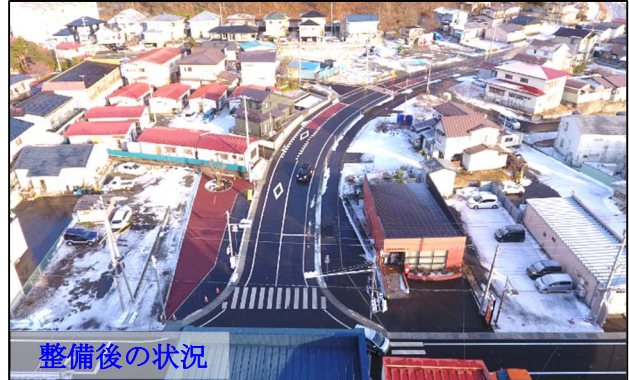
(一) 二戸軽米線 長嶺工区 (二戸市) ※R3 完了