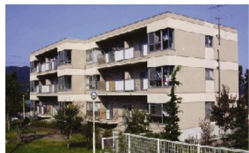
県営石切所団地(二戸市)

入居や募集等に関するお問い合わせは、指定管理者である(一財)岩手県建築住宅センター(TEL:019 623 4414)までお願いします。