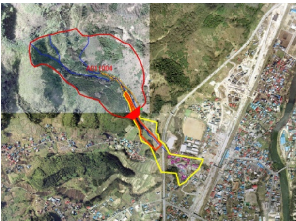
通常砂防事業(二戸市石切所の沢) R2～R9 予定

土石流による被害を防止するため、土石流対策施設の整備(砂防事業など)、がけ崩れから生命や財産を守るため、がけ崩れ対策施設の整備(急傾斜地崩壊対策事業)、地すべりによる被害を防止するため、地すべり対策施設の整備(地すべり対策事業)などの事業を行っています。