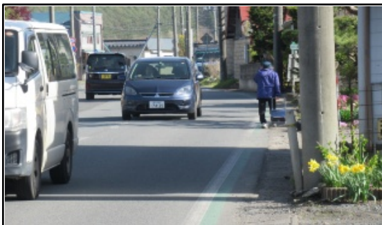
(国)340号 長興寺工区(九戸村) R3~R8 予定

緊急輸送道路等に架かる対象橋梁について、耐震性能を確保するよう耐震補強工事を実施しています。