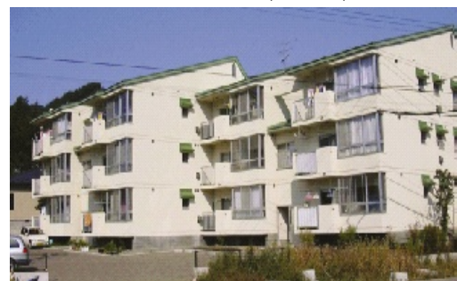
県営北福岡団地(二戸市)