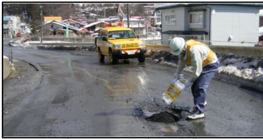
パトロールによる穴埋め作業

舗装や橋などは次第に老朽化し、放置することにより事故に繋がる恐れがあることから、これを未然に防ぎ道路が常時良好な状態に保たれるように道路パトロールを行っています。また、側溝清掃、草刈、路面の穴埋めや側溝蓋交換などの維持修繕工事を行っています。住民のみなさんからの通報についても、早期に現地確認を行い対応するよう努めています。