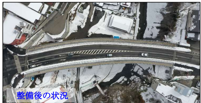
(都) 荒瀬上田面線 岩谷橋工区 (二戸市) ※R6 完了