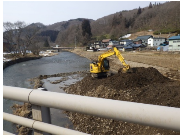
河道断面維持のための掘削作業