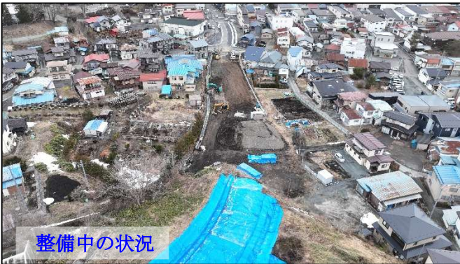
(一) 二戸軽米線 新町工区 (軽米町) ※R2~9 予定