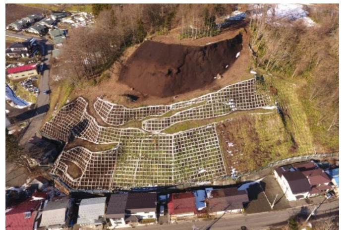
急傾斜地崩壊対策事業(二戸市八幡館地区) R3 完了