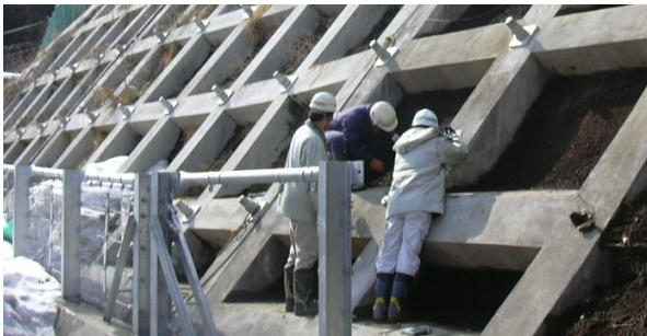
県営建設工事完成検査状況