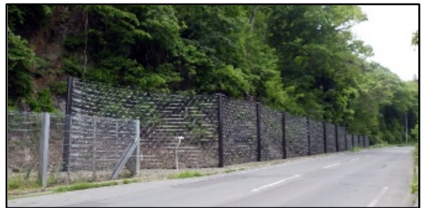
(一)二戸一戸線 小間木地区(二戸市) R4 完了