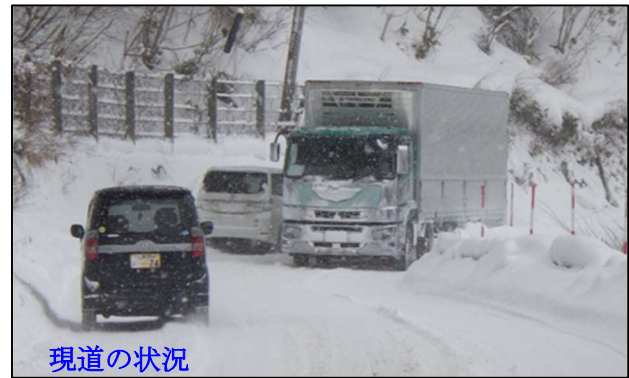
(主) 二戸五日市線 柿ノ木平工区 (二戸市) ※R3~12 予定