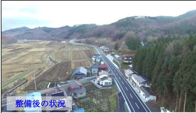
(一) 一戸浄法寺線 中里工区 (一戸町) ※R3 完了

幅員狭小、急勾配、急カーブなどの交通の難所を解消し、交通を円滑にすることにより所要時間の短縮、交通安全の確保、冬期交通の確保等に努めます。