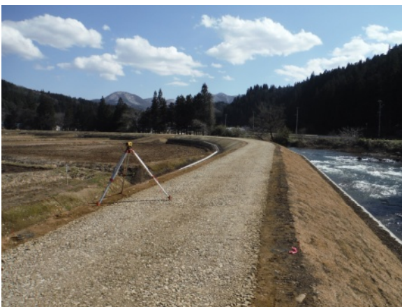
河川改修事業(一級河川安比川 二戸市門崎地区) R2～R11 予定

比較的発生頻度の高い洪水に対して、洪水を安全に流下させるために、洪水の流れる断面を大きくするなどの事業を進めています。また、河川は、人が水辺の多種多様な動植物とふれあうことが出来る空間です。地域の暮らしや歴史・文化との調和にも配慮し、河川が本来有している生物の生息・生育・繁殖環境及び多様な河川景観を保全・創出しながら、河川管理(改修)を行っています。