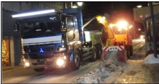
ロータリー車による除雪作業

岩手県で最も北に位置する二戸地域では、降雪や路面凍結により、人や車の安全、円滑な交通が妨げられています。そのため、通勤通学、帰宅時の除雪や融雪剤散布を行い、道路利用者の安全確保をおこなっています。また、道路脇法面からの落石や倒木などから道路利用者の安全を確保するため、危険箇所へ落石防護柵を設置しています。