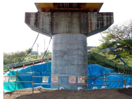
(主)二戸九戸線 二戸大橋(二戸市) R4~R12 予定