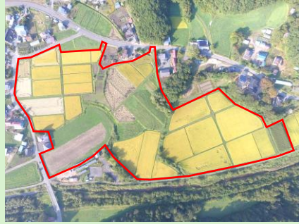
【林郷下地区】整備前 (担い手への農地集積率26%)