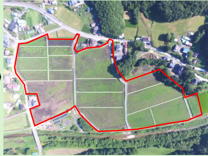
【林郷下地区】整備後 (担い手への農地集積率84%)

営農の継続を通じて農業・農村の維持・発展を図るため、地域の実情に応じたきめ細かな基盤整備を支援しています。