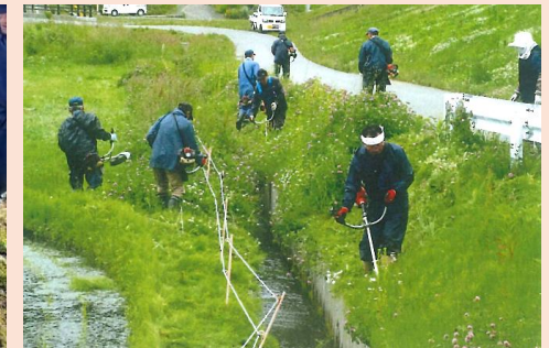
【中山間地域等直接支払】農地周辺の草刈状況 (野田村：米田集落協定)