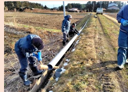
【多面的機能支払】水路の補修状況 (洋野町：宿戸地区環境保全組合)