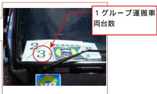
1グループ運搬車両台数