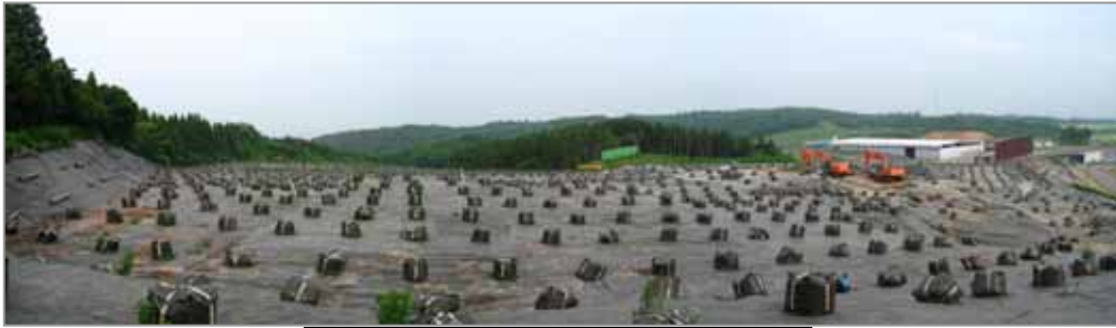
A 地区状況 (H19.7 撤去完了)

平成 19 年度に県は 41,205 トンの廃棄物を撤去しました。なお、業者の自主撤去で 3,869 トンを撤去した結果、撤去済み量は 45,074 トンとなり、今年度目標 42,000 トンを達成しました。