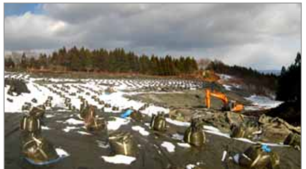
B 地区廃棄物撤去作業 (H19.12 状況)