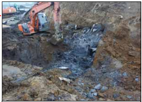
D地区から掘削した汚泥（灰色の部分）。1トンの大型の袋で400袋以上まとめて確認された。

今月は、不法投棄現場に投棄された廃棄物についてお知らせします。現場には、様々な廃棄物が捨てられており、写真は現在掘削中の廃棄物で、未開封の廃食品と汚泥です。