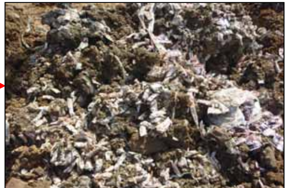
O地区から掘削した廃食品。袋容器に入ったままのタレ。