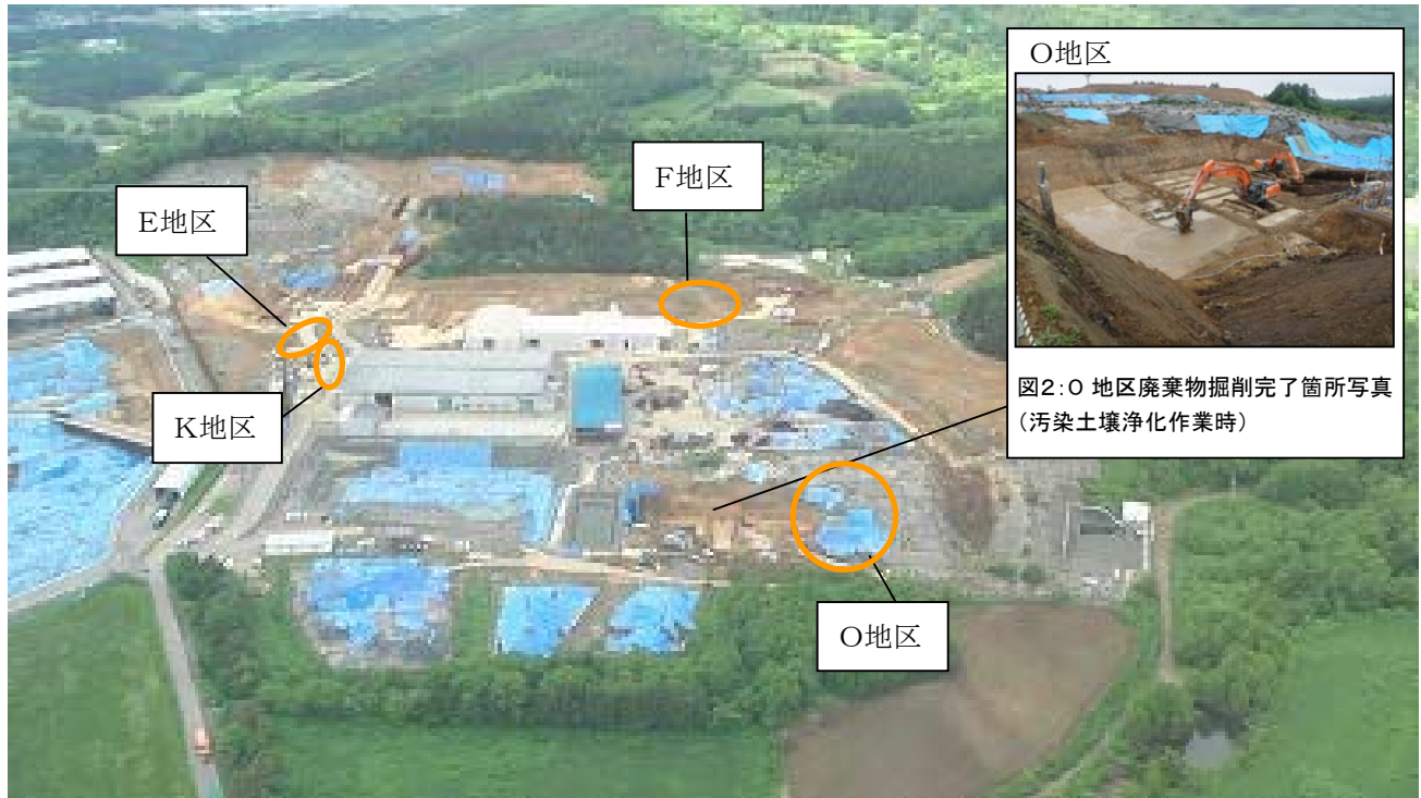
図 1 : 県境不法投棄現場上空写真 (平成 24 年 6 月 11 日不法投棄防止スカイパトロール時撮影)

図1に6月 11 日の不法投棄防止スカイパトロールの際に撮影した、青森・岩手県境不法投棄現場周辺(岩手県側)の上空写真を示します。平成 24 年度はE地区、F地区、K地区、O地区の丸枠で示す部分に残る廃棄物を掘削するとともに、図2に示すように、掘削が完了した箇所のうち、土壌汚染が見られるところについて、順次汚染土壌浄化対策を講じています。