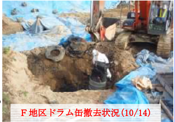
F 地区ドラム缶撤去状況(10/14)