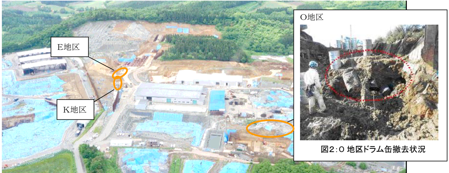
図 1：県境不法投棄現场上空写真（平成 24 年 6 月 11 日不法投棄防止スカイパトロール時撮影）

平成 24 年 11 月 17 日に開催された第 54 回原状回復対策協議会で、次のことが話し合われました。