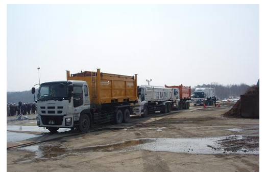
図 1：廃棄物を積載した車両

県境部の遮水工については、3 月 4 日から鋼矢板の設置工事を進めており、早期の工事完了を目指しています。