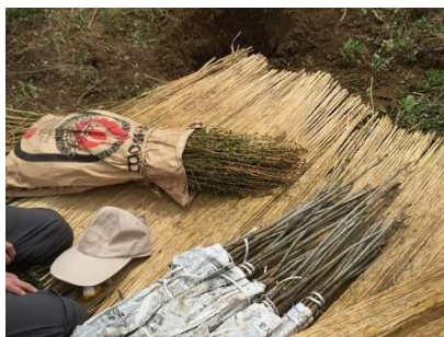
写真 植栽前の苗木 (左 カラマツ 右 ウルシ)