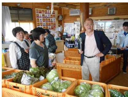
第 1 回目の指導状況