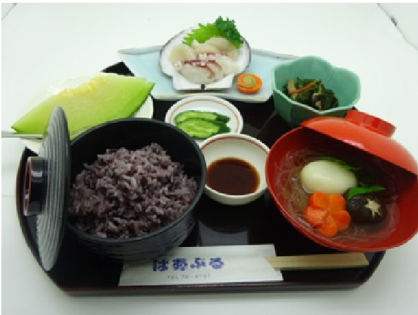
けいらん (写真右)、昆布の煮物 (写真右上)、海の幸 (写真中央上)、古代米 (写真左)