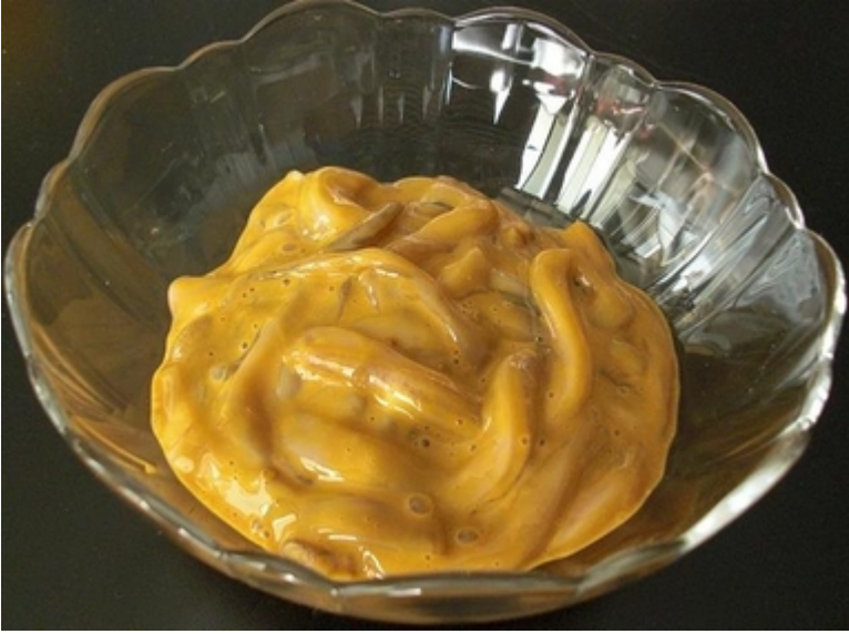
郷土料理 「イカの切り込み」