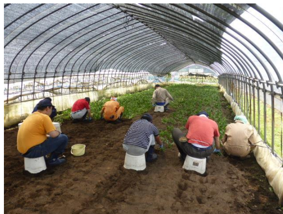
↑ 向田農園での作業の様子