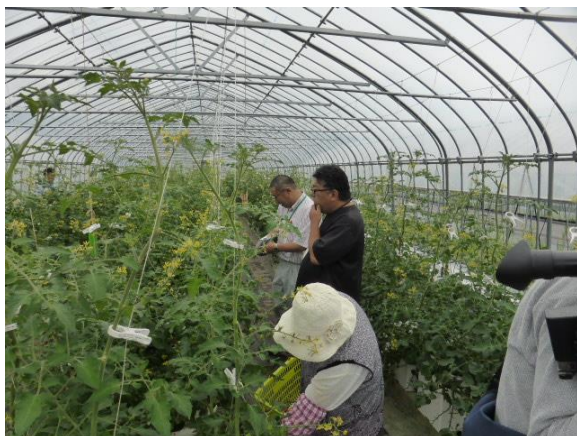
↑ 第2回農作業見学会（ミニトマト）の様子（8/29）

菌床しいたけ栽培作業について、第4回目の見学会を9月下旬以降に開催する予定です。