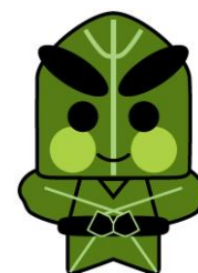
久慈地方ほうれんそう宣伝部長

事業者の責任において、科学的根拠に基づいた機能性を表示した食品。販売前に安全性及び機能性の根拠に関する情報などが消費者庁長官へ届け出られたもの。