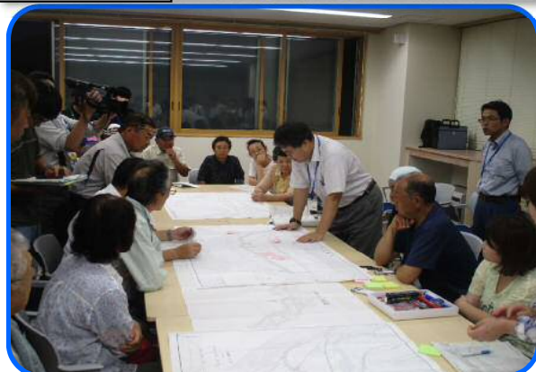
意見交換会の様子(H29.7.25中島地区)