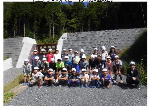
砂防堰堤前で記念写真！

生徒の皆さまからは、「土砂災害は土石流・地すべり・がけ崩れの3種類があることが分かった。」「避難のタイミングが分かった」「模型実験により、砂防堰堤の仕組みが分かった」などの声がありました！