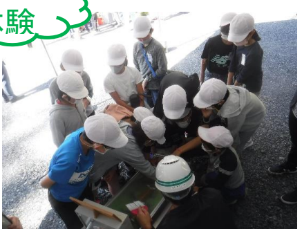
模型実験により砂防堰堤の効果を学習