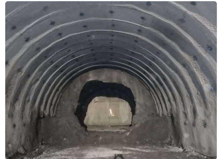
貫通直前のトンネル切羽