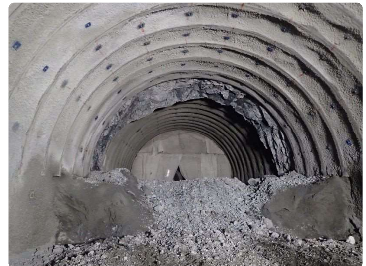
貫通後のトンネル切羽