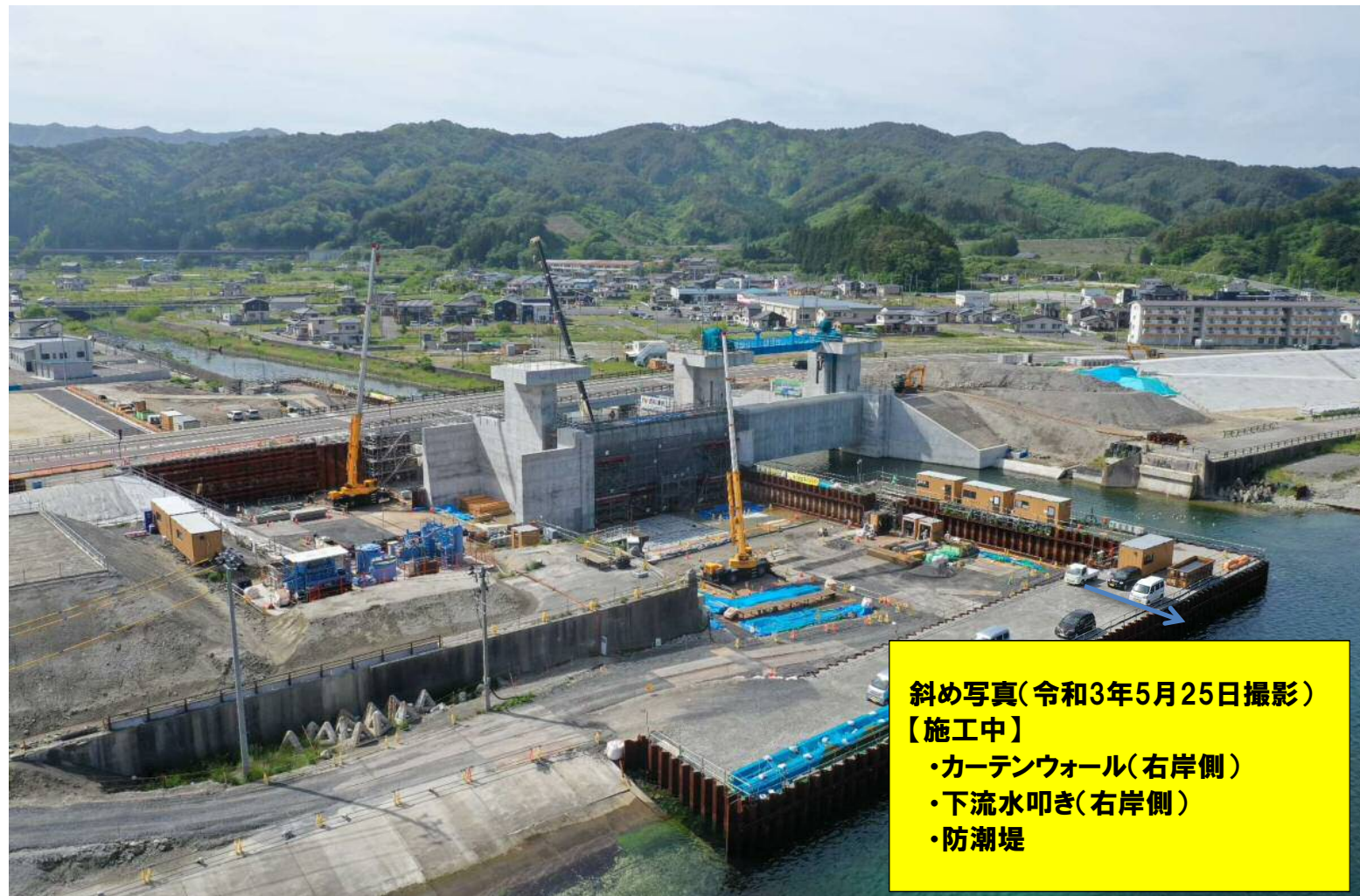
斜め写真(令和3年5月25日撮影) 【施工中】 ・カーテンウォール(右岸側) ・下流水叩き(右岸側) ・防潮堤