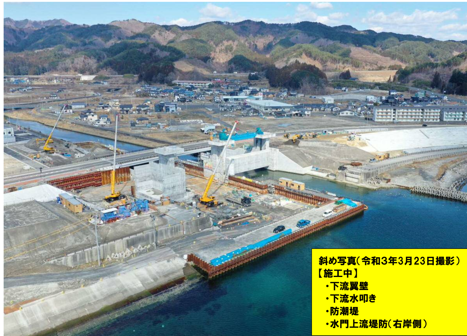
斜め写真(令和3年3月23日撮影) 【施工中】 ・下流翼壁 ・下流水叩き ・防潮堤 ・水門上流堤防(右岸側)