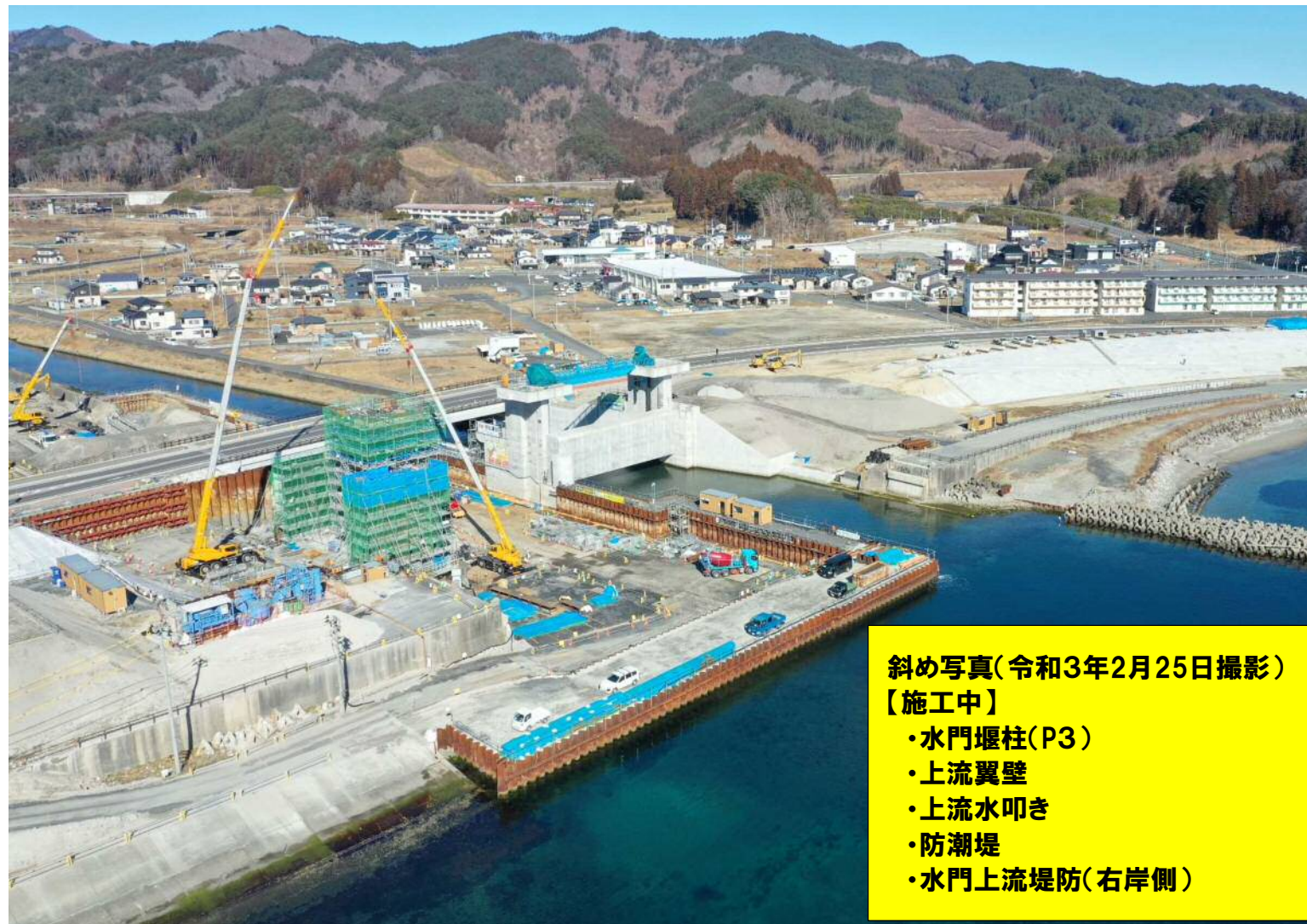
斜め写真(令和3年2月25日撮影) 【施工中】