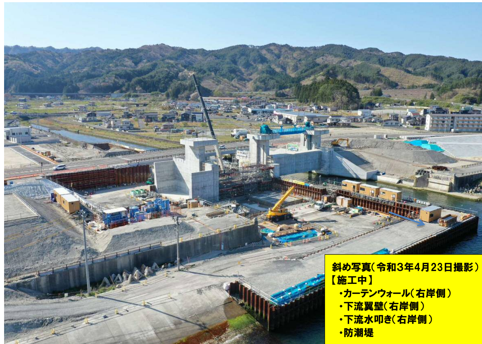
斜め写真(令和3年4月23日撮影) 【施工中】 ・カーテンウォール(右岸側) ・下流翼壁(右岸側) ・下流水叩き(右岸側) ・防潮堤