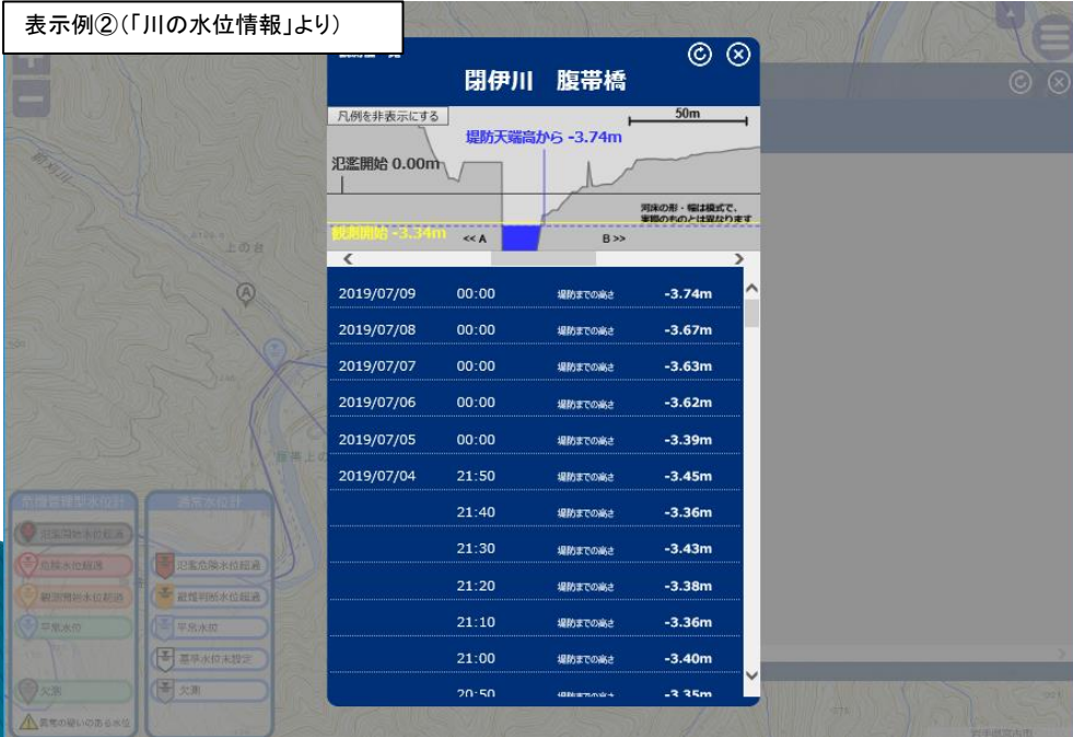
表示例②(「川の水位情報」より)