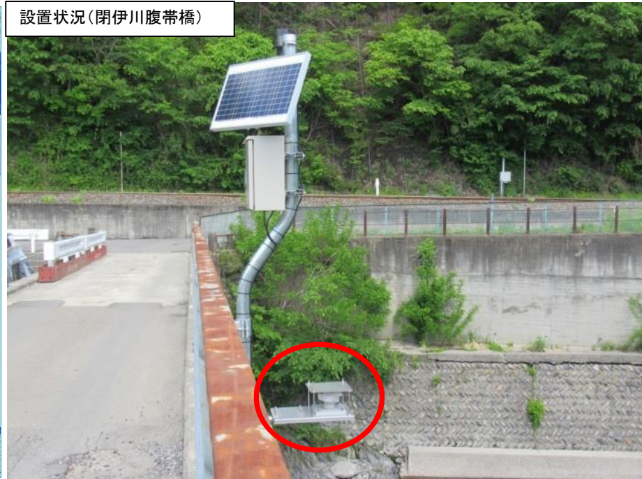
設置状況(閉伊川腹帯橋)