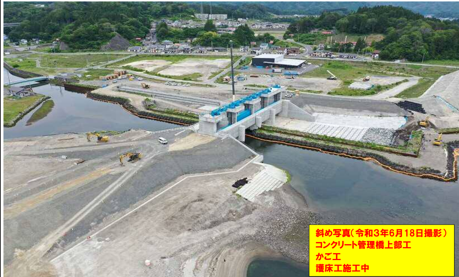
斜め写真(令和3年6月18日撮影) コンクリート管理橋上部工 かご工 護床工施工中