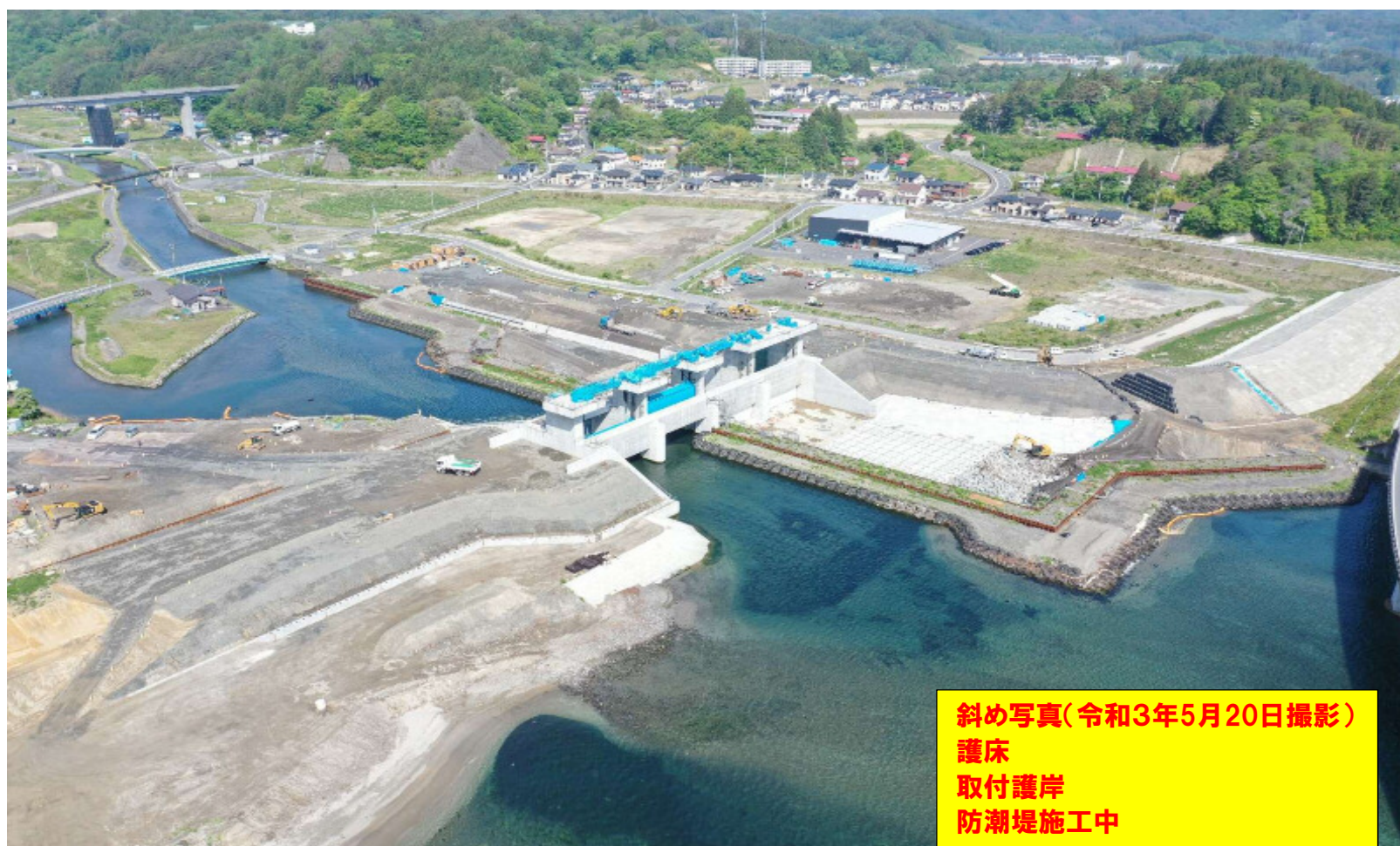
斜め写真(令和3年5月20日撮影) 護床 取付護岸 防潮堤施工中