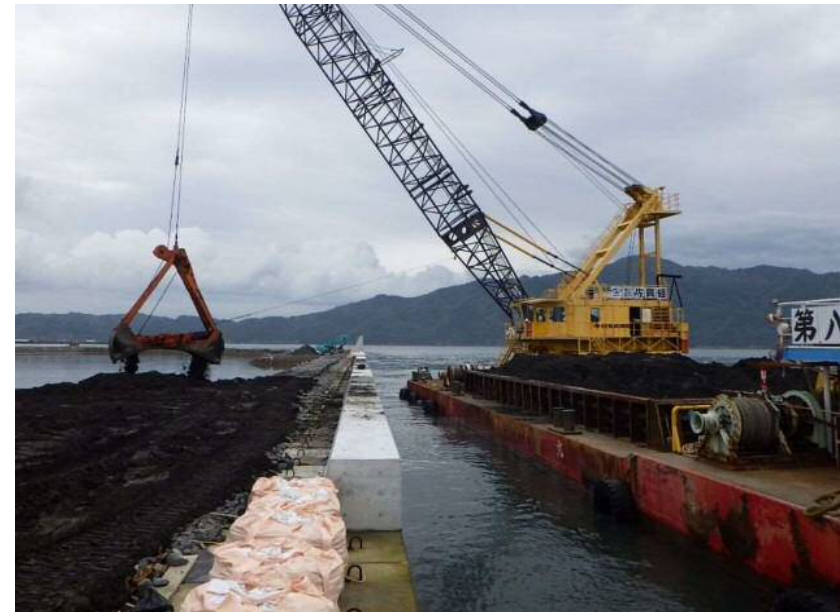
現在は埋め立てのための土砂投入をしています。写真は令和2年10月末撮影