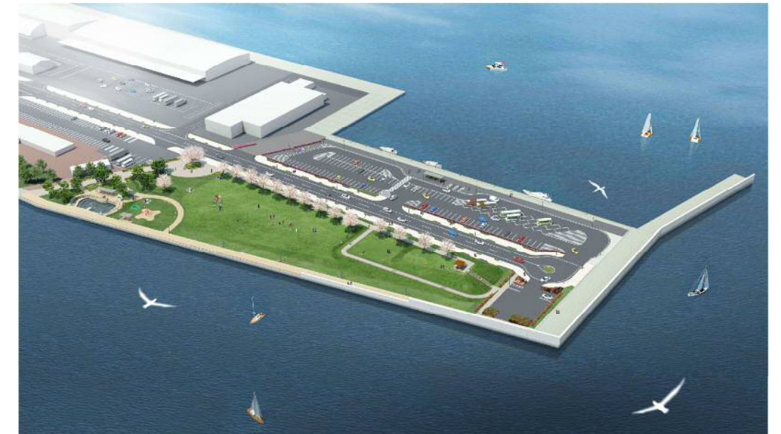
※現時点での完成イメージであり変更となる場合があります。