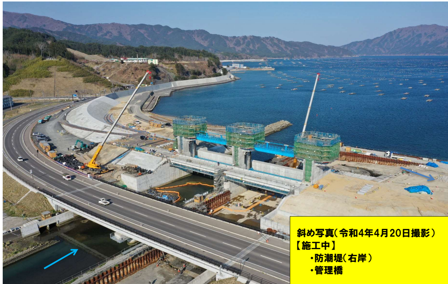
斜め写真(令和4年4月20日撮影) 【施工中】 ・防潮堤(右岸) ・管理橋