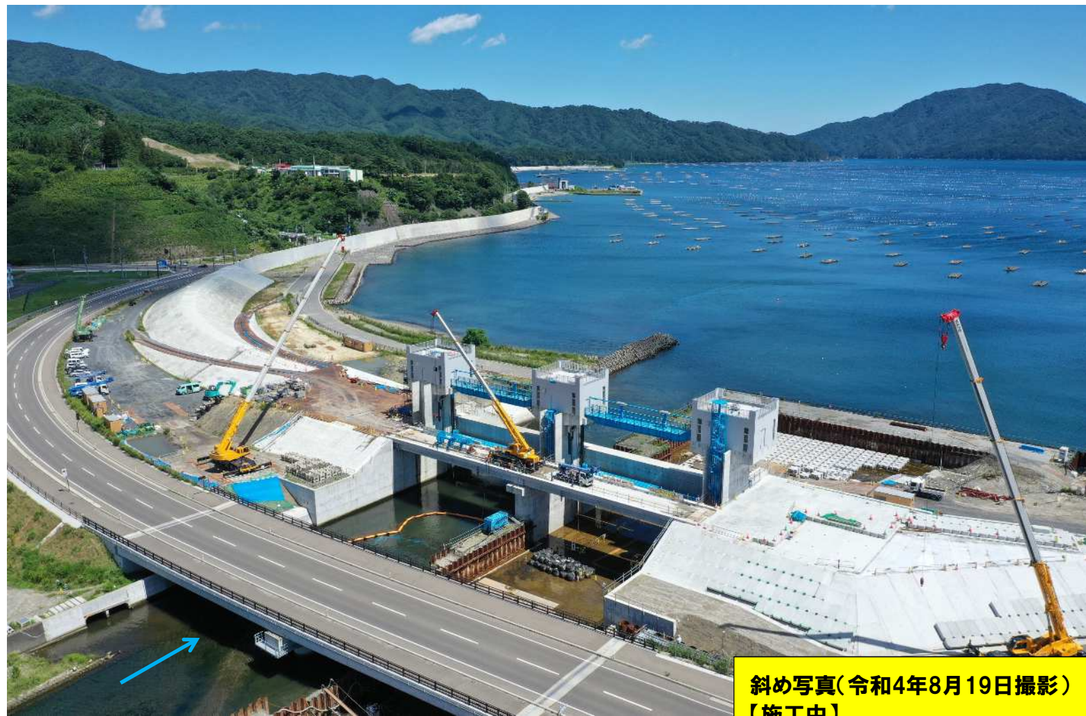
斜め写真(令和4年8月19日撮影) 【施工中】 ・防潮堤(右岸) ・螺旋階段