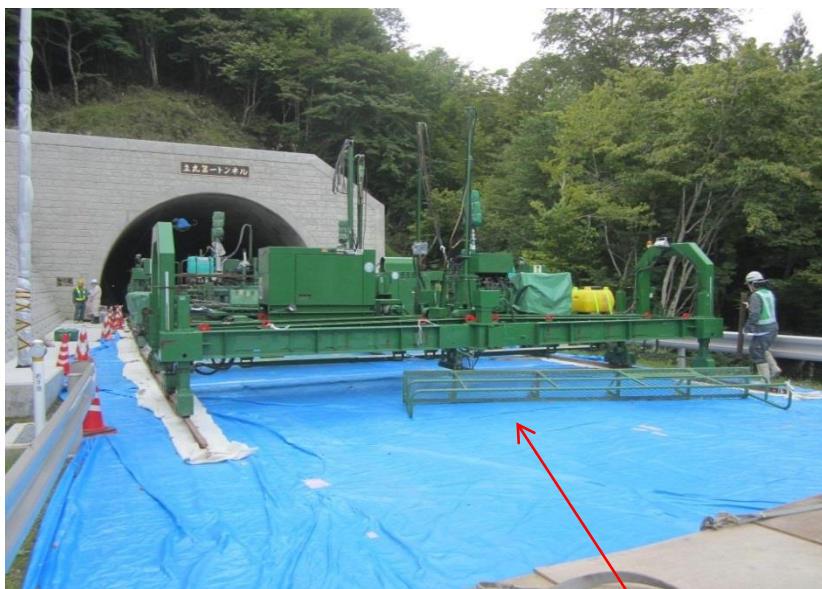
トンネル内舗装 コンクリートを均す機械です