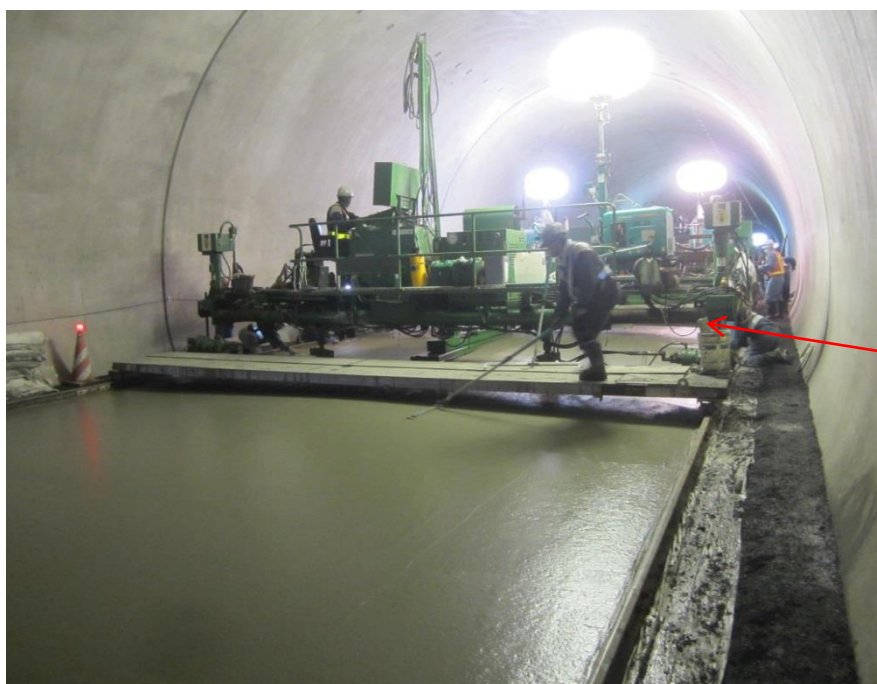
トンネル内舗装コンクリートの 表面を仕上げる機械です