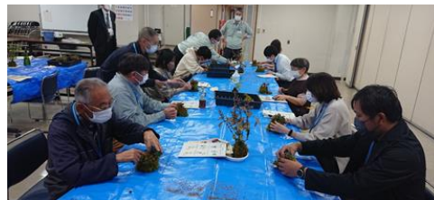
苔玉づくり講習会の様子