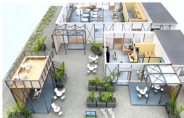
南三陸ワイナリー完成イメージ

ワイナリーは、醸造棟のほか、試飲・販売のショップ棟、潮風を感じながら飲食を楽しむテラスを備えています。是非、海を眺めながら美味しいワインを楽しんでみませんか。