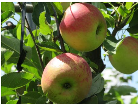
〈栽培しているりんご：さんさ〉

明治22年頃から現在に至るまでの約130年間米崎の地に受け継がれている米崎りんご…そのりんごは、バブルや震災による離農という困難を乗り越えて来ました。現在LAMPでは、20種類以上のりんごを育てており、旬のりんごを販売しています。