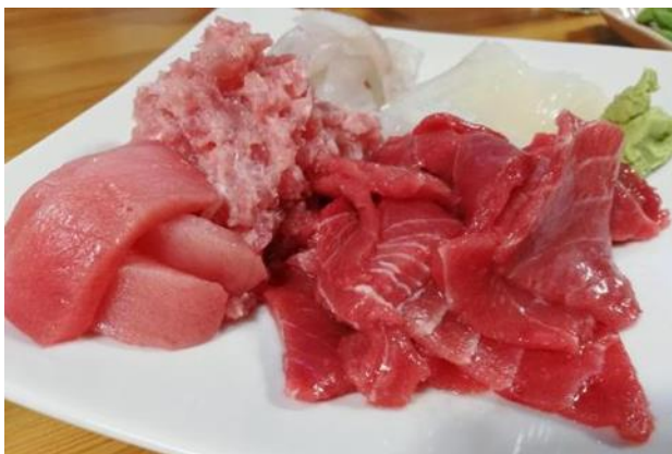
(左手前がビンチョウマグロ)

全長は1m程度で体重は約25kgとマグロの中では比較的小ぶりの魚です。肉質は柔らかく、淡いピンク色、あっさりとした味わいが楽しめる魚で、気仙沼地域では主に刺身で食されています。