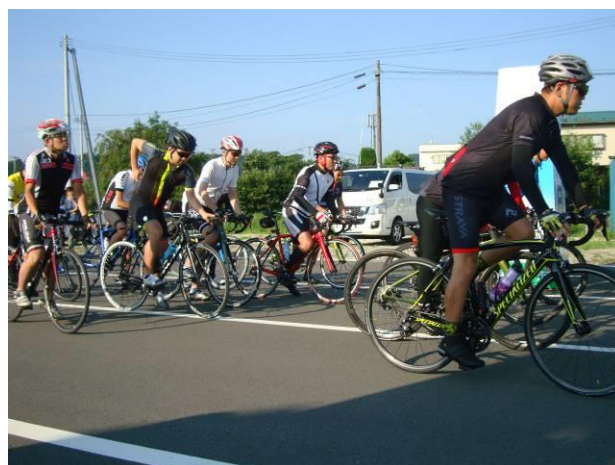
(颯爽と走り出す選手)

途中、エイドステーションでは、そば団子やトマト、ジェラートなど地元の特産物を味わいながら、栗原の暑い夏のひとときを過ごしていました。