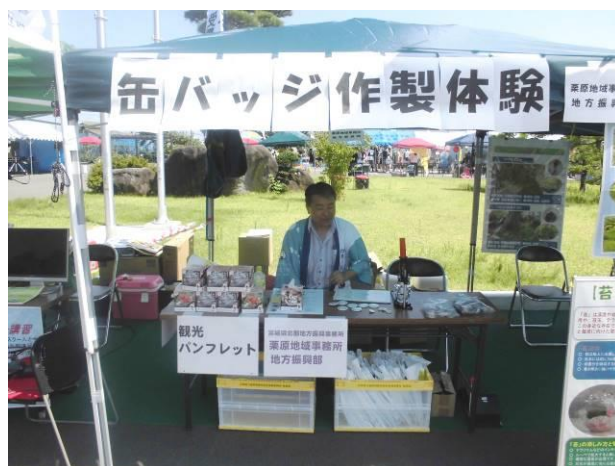
(県が出店したブース)