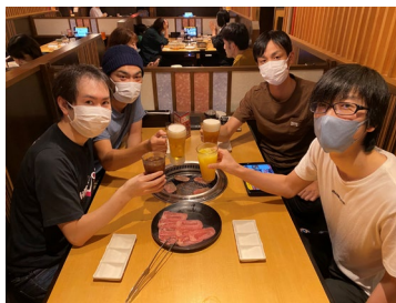
飲みニケーション（2022年11月）

コミュニケーションを大事にしており、飲みニケーション（費用は会社負担の懇親会）や社員旅行、他拠点と交流を深めることができます。「同好会推奨制度」という制度もあり、社員同士が 仕事の場を離れて交流を深める こともできます。