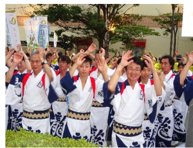
水沢ざつつあか祭り