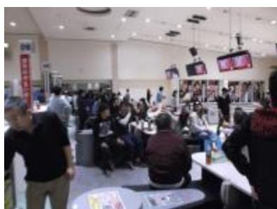
新入社員とボウリング♪

また、宮城県大衡村にある“大衡の森”での植樹ボランティアなどさまざまな活動にも毎年参加をしています。